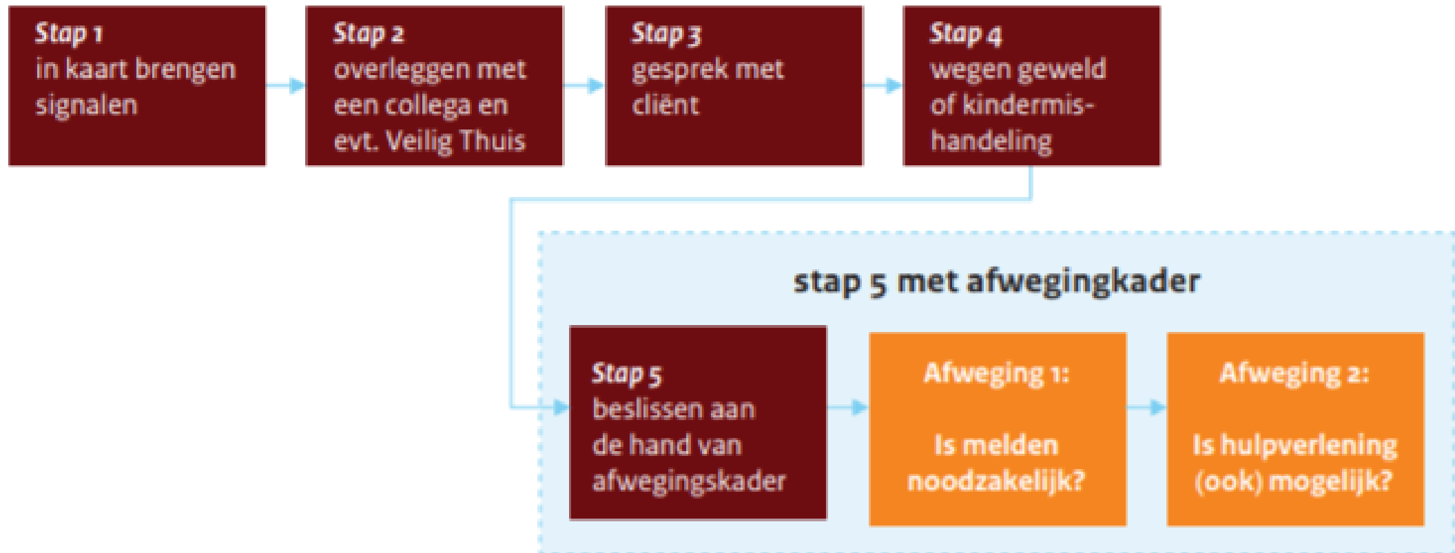
Figuur 2: Nieuwe situatie: Meldcode met afwegingskader